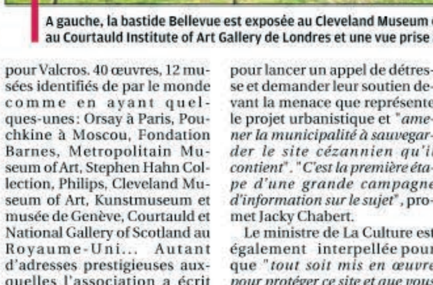
A gauche, la bastide Bellevue est exposée au Cleveland Museum of Art. A droite, "la montagne Sainte Victoire au grand pin" appartenant au Courtauld Institute of Art Gallery de Londres et une vue prise au XXI e .

pour Valcros. 40 œuvres, 12 musées identifiés de par le monde comme en ayant quelques-uns: Orsay à Paris, Pouchkine à Moscou, Fondation Barnes, Metropolitan Museum of Art, Stephen Hahn Collection, Philips, Cleveland Museum of Art, Kunstmuseum et musée de Genève, Courtauld et National Gallery of Scotland au Royaume-Uni... Autant d'adresses prestigieuses auxquelles l'association a écrit