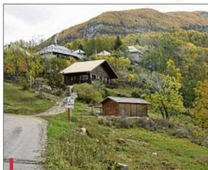
Au hameau Les Gaillards, des habitants évoquent depuis longtemps une origine locale à la famille Cezanne.